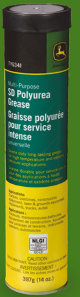
Grasa Multipropósito Polyurea SD. TY6341

Ahorrá tiempo y dinero mientras incrementás la vida útil de piezas clave de tu equipo.